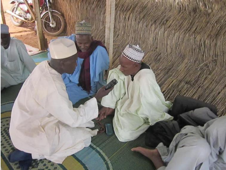
Kuva 3. Sawtu Linjiilan evaluaatio toteutettiin kuulijoiden haastatteluina.

Amharankielinen lastenohjelma on mediaosaston saaman palautteen perusteella tullut koronapandemian aikana entistä tärkeämmäksi, koska koulut ovat olleet suljettuina. Ohjelman formaattiin kuuluisi lasten mukanaolo ohjelmissa, mutta koronapandemian aikana tämä ei ole ollut mahdollista.