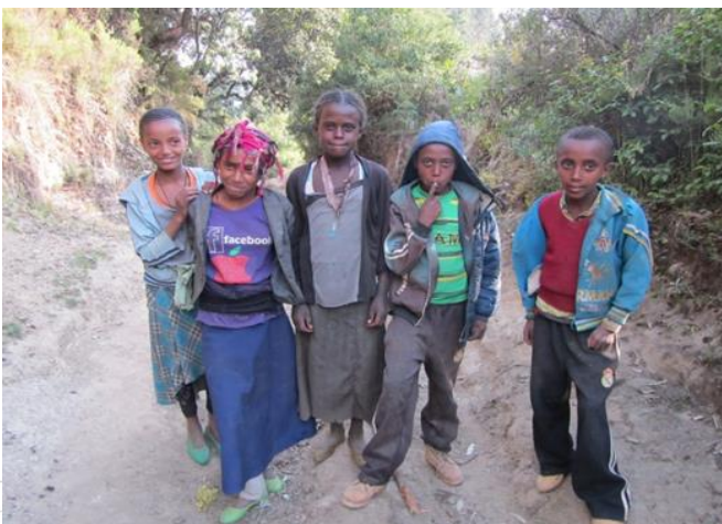
Kuva 2. Etiopiassa koronapandemia on sulkenut koulut ja lasten radio-ohjelman suosio on kasvanut.

Etiopia kärsi maan pohjoisosan itsenäisyystaisteluista ja koronaviruksen tuomista rajoituksista. Maan talous on heikentynyt, ihmisten elinolosuhteet huonontuneet levottomuuksien ja rahan arvon laskun takia. Tunnelma on ajoittain pelonsekainen. Näissä olosuhteissa mediaosasto jatkoi ohjelmien tuottamista, vaikka töitä täytyi tehdä kotoa käsin.